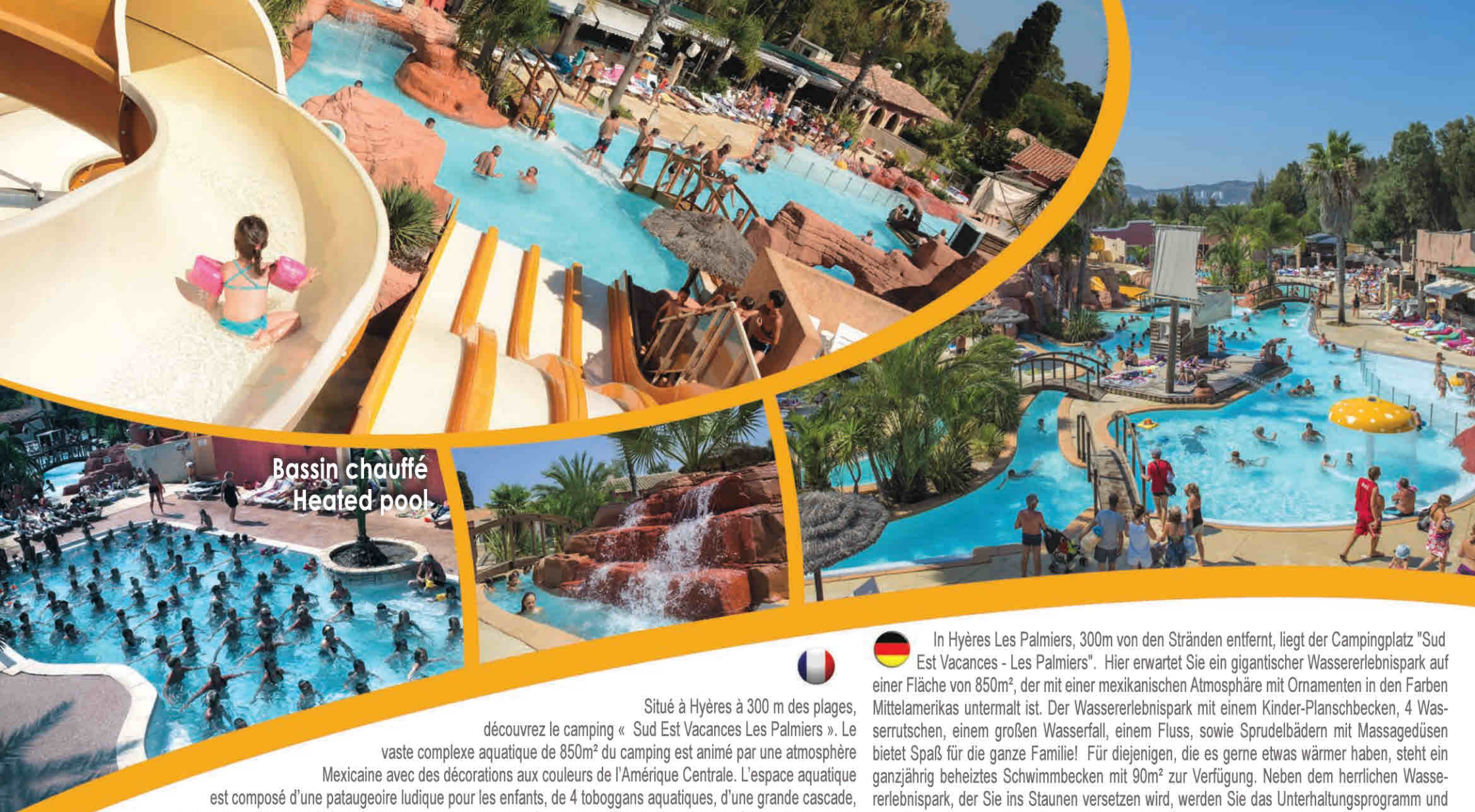
Bassin chauffé Heated pool